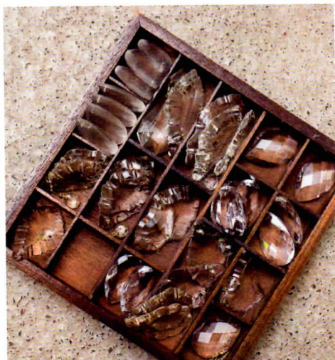
Puretuista valaisimista jäljelle jääneet kristallit ovat kauniisti esillä vanhan lipaston laatikostoissa.