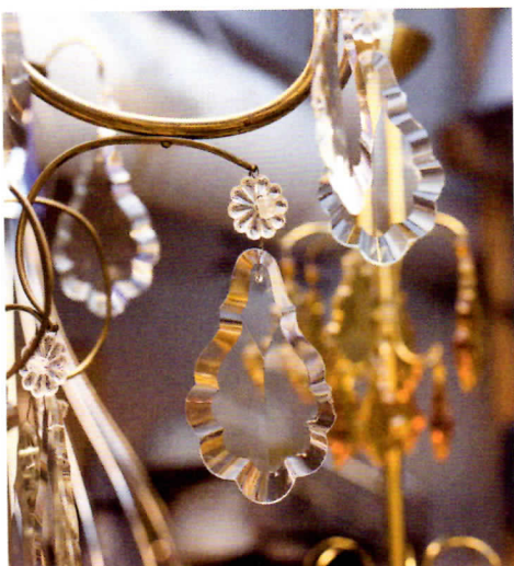
Yksityiskohdat lumoavat kauneudellaan. Rajala hyödyntää muidenkin käsityöläisten taitoja.

diplomi-insinööri. Opintoni olivat yhdistelmä kone-, automaatio- ja sähkötekniikkaa. Aiemmassa työssäni tein kunnossapidon projekteja teollisuuden puolella. Näin olen oppinut, millaista tekniikkaa tarvitaan. Valaisimet ovat tulleet tutuiksi myös harrastukseni kautta, sillä olen tehnyt valo- ja äänitöitä harrastajateatterin puolella.