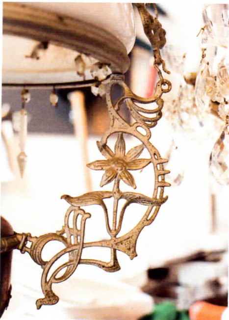
Valaisinkorjaamo Pannuhuoneen myymälä on paratiisi vanhojen valaisimien ystäville. Viehättävä historiallinen ympäristö luo tunnelmaa.