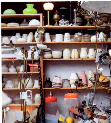
Mitään ei heitetä pois. Ylimääräisille lasikuvuille ja varjostimille saattaa olla käyttöä myöhemmin.