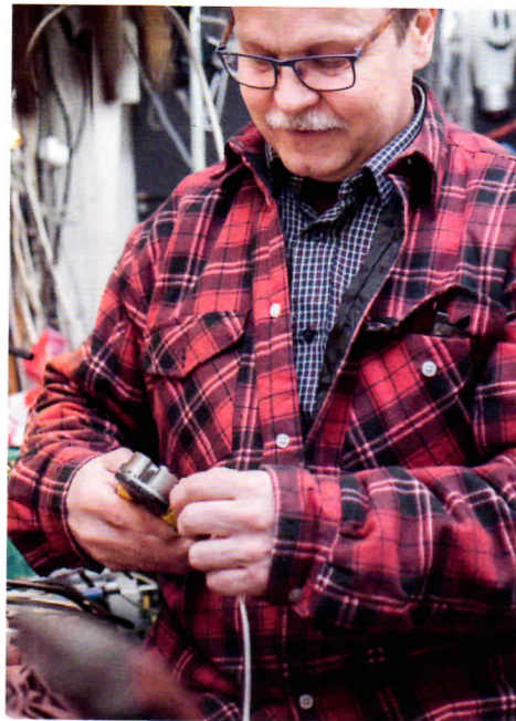
Sähkötyöt on hallittava täydellisesti. Valaisimen entisöinnissä on vaalittava alkuperäistä, mutta myös turvallisuus on otettava huomioon.